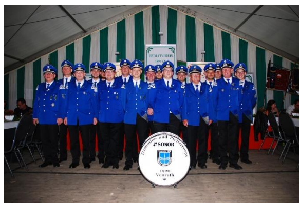
Das Trommler und Pfeifercorps Venrath