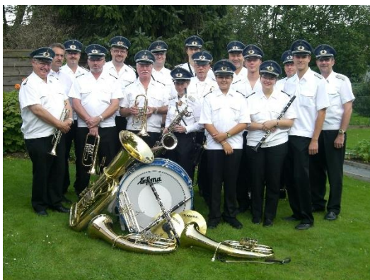
Musikverein Hochneukirch e.V.