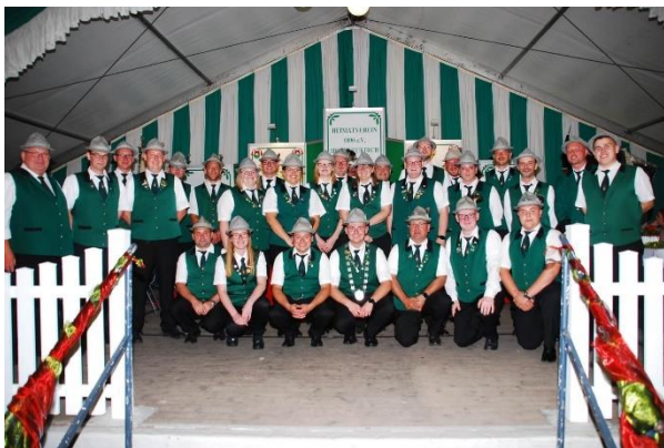
Jägerkapelle Hochneukirch e.V.

Aber auch während der Umzüge und Paraden sind unsere Musiken das eigentliche Highlight des Festes. Verstärkt werden unsere Musiken bereits seit fast 60 Jahren vom Trommler und Pfeifercorps Venrath. Dieses Jahr erstmalig am Schützenfestsonntag und Montag dabei: Das neue Tambourcorps Wanlo! Wir sind gespannt auf ein großartiges Schützenfest mit unseren Musikzügen.