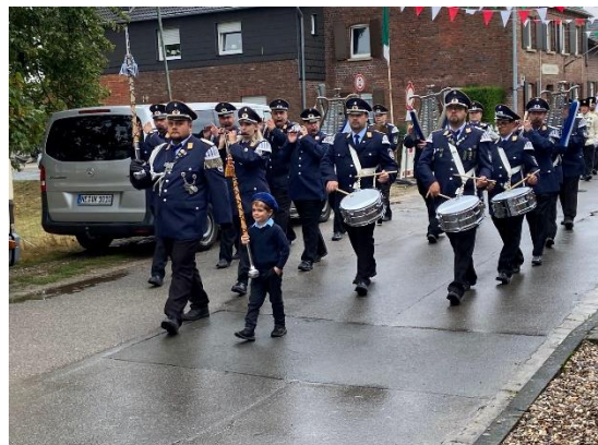
Tambourcorps 06 Hochneukirch e.V.