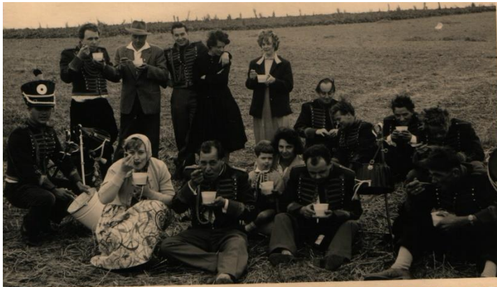
Manöverpause am Schramberg

Weit über hundert Jahre hat sie schon Tradition. Die „Echt Nöckercher Erbsensuppe“. Immer zum Schützenfestdienstag, zog damals das Regiment in das Manöver. Morgens wurden zwei Gruppen gebildet. Eine Gruppe hatte die Aufgabe den König zu verteidigen und die andere Gruppe musste ihn gefangen nehmen. So zog man mit