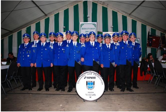
Das Trommler und Pfeiferkorps Venrath